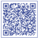
QRコードを使って、申込サイトに簡単にアクセスできます。

インターネットから上記の「仏の里くにさき・とみくじマラソン大会」の公式HPにアクセスし、エントリーの手続きを済ませてください。参加料とは別にエントリー手数料がかかります。エントリー手数料は、支払総額4,000円までが205円、4,001円以上5.15%(税込)となっております。