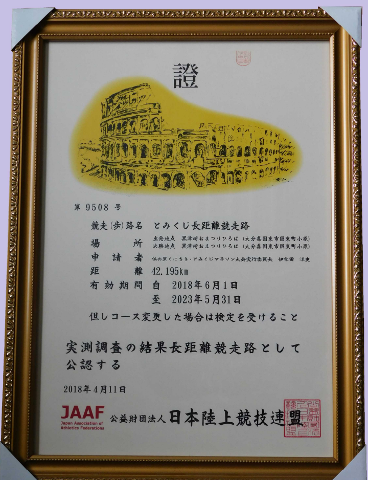
日本陸連から事務局に届いた公認大会の証書

10kmの折返しは、北江簡易郵便局前付近、ハーフマラソンの折返しは、富来の友僧入口付近となっています。フルマラソンは、藁藁に上らず、大恩寺から直接、犬鼻峠を越え、不評だった山岳コースの上り坂を一つ減らすことになり、ランナーからも歓迎されるコースとなりました。 実行委員会では、「会場移転によりスタート・フィニッシュの会場も随分スマートな感覚となり、高低差もかなり解消され好記録が生まれるのではないかと期待しているところです。大分県一の市民マラソン大会となったとみくじマラソン大会を通じて地域が活性化し、賑わいのある町づくりに貢献できたらと願うばかりです。」と話しています。