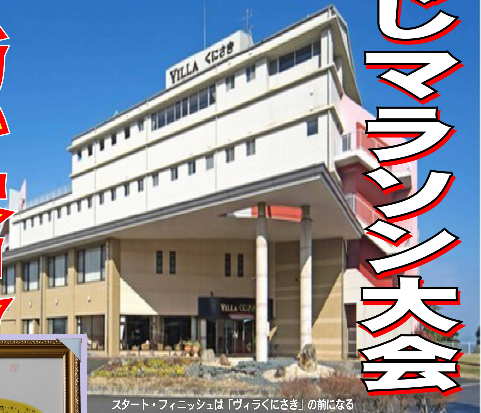
スタート・フィニッシュは「ヴィラくにさき」の前になる